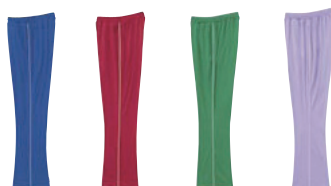
20 ロイヤルブルー 43 エンジ 09 グリーン 76 ライトパープル