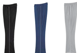
02 ブラック 03 ネイビー 28 シルバーグレー